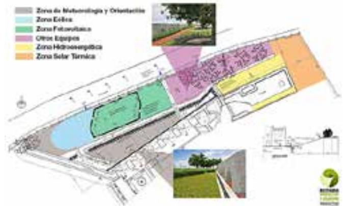
Fig. 2. Vista en planta Ceder.

En un inmueble contiguo al Jardín de las Energías, al lado del estanque, se habilitará el «Aula de Energías Renovables», un espacio multifuncional para la realización de conferencias, cursos y talleres y para la exposición de equipos y nuevos productos relacionados con las FRE (Fig. 4).