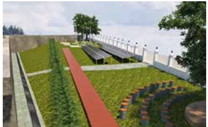
Fig. 3. Imagen 3 d Ceder.