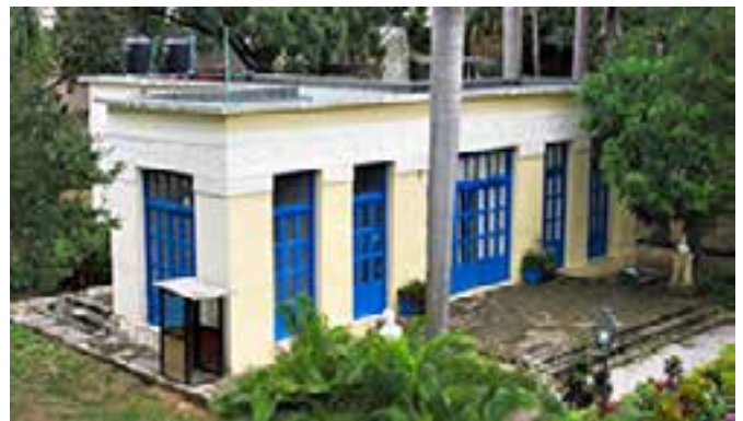
Fig. 4. Foto Pabellón.