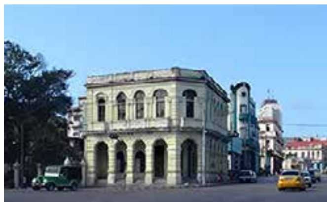
Fig. 5. Vista del edificio de la Quinta de los Molinos.

La cubierta del edificio socio administrativo (en Carlos III e Infanta) tiene un área de unos 345 m 2 (15 x 23 m) y se ha diseñado un Sistema fotovoltaico (SFV) de inyección a red sobre cubierta compuesto por 72 paneles con orientaciones Este-Oeste (36 en cada dirección); con una potencia pico instalada de 28.8 KWp, este SFV representa una energía anual generada de unos 45,82 MWh/año (Fig. 5).