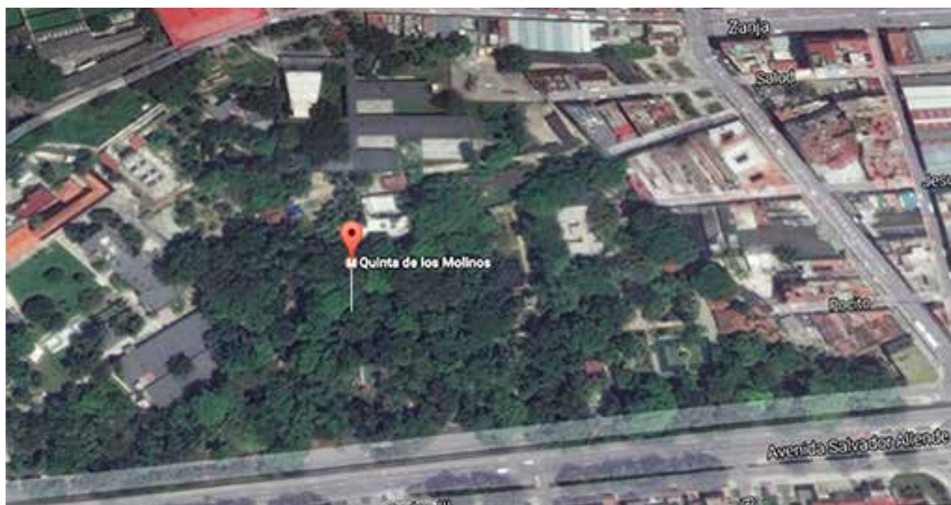
Fig. 1. Imagen aérea de la Quinta de los Molinos.

Para la ejecución de este Proyecto se cuenta con el financiamiento de la Agencia Extremeña de Cooperación Internacional para el Desarrollo (Aecid), el acompañamiento de las Fundaciones «Ciudadanía» y «ACPP» y con la colaboración, en su concepción y posterior funcionamiento, de especialistas de diferentes instituciones cubanas, entre las que destacan Cubasolar, el Laboratorio de Investigaciones Fotovoltaicas del Instituto de Ciencia y Tecnología de Materiales (IMRE) de la UH, el Ministerio de Energía y Minas, el Centro de Estudio de Tecnologías Energéticas Renovables (Ceter) de la Universidad Tecnológica de La Habana José A. Echevarría, la Universidad Pedagógica Enrique José Varona y el Instec, también perteneciente a la UH.